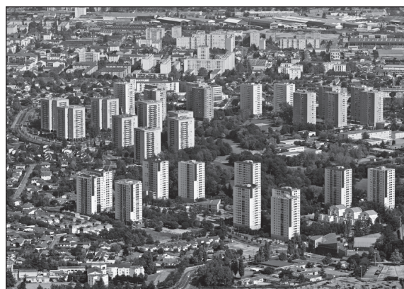
Doc. 2 Le quartier des Minguettes, grand ensemble résidentiel, 2012.

Aujourd'hui, des projets de rénovation urbaine essaient de rendre ces quartiers plus attractifs et plus agréables à vivre.