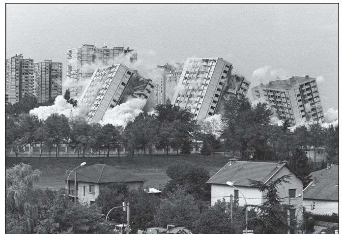
Doc. 7 Destruction de dix tours du quartier des Minguettes à Vénissieux en 1994.