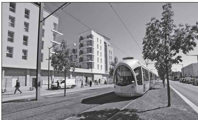
Doc. 3 Le tramway, un nouvel axe de développement du quartier.