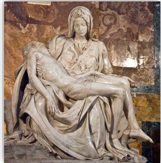
Sculpture : La pieta