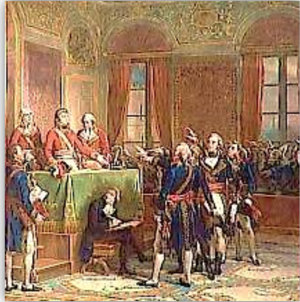
Doc 1 : Une assemblée en présence des trois consuls.

Le 2 décembre 1804 il se fait sacrer Empereur sous le nom de Napoléon I er en présence du pape à Notre-Dame de Paris.