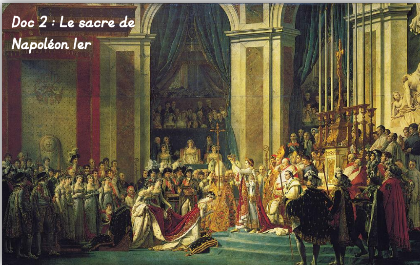
Doc 2 : Le sacre de Napoléon I er

Pour que son sacre soit aussi imposant que celui de Charlemagne en l'an 800, il a demandé au pape de venir. Mais comme il considérait que son autorité lui venait des français, non de Dieu, il a lui-même posé la couronne sur sa tête, puis s'est retourné pour sacrer sa femme Joséphine, impératrice. Le sacre de Napoléon est caractéristique de l'ambiguïté des Français : ils voulaient la liberté et l'égalité acquises sous la Révolution et le retour à l'ordre voire l'autorité d'un souverain.