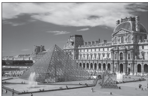
Doc. 5 Musée du Louvre à Paris.