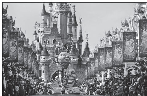
Doc. 6 Parc d'attraction de Disneyland Paris à Marne-la-Vallée.