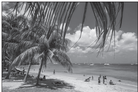
Doc. 2 Plage de la Martinique.