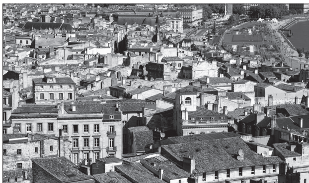
Doc. 1 Le quartier du centre-ville.