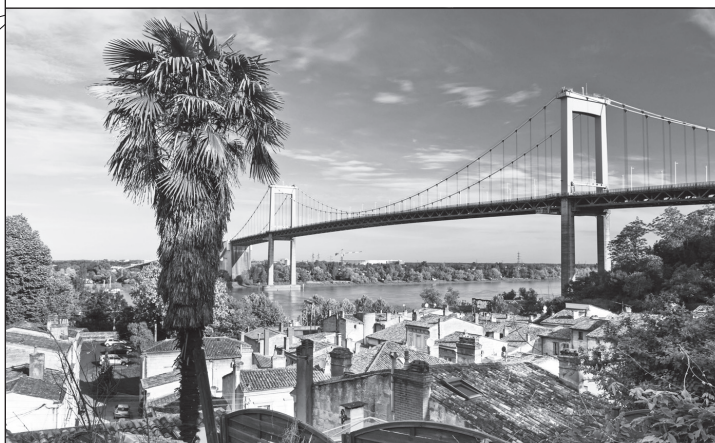
Doc. 3 La commune de Lormont, sur la rive droite de la Garonne.